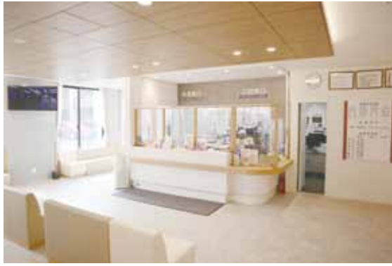
外来受付・待合室