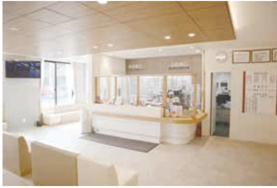
外来受付・待合室