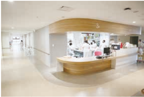
スタッフステーション（病棟）