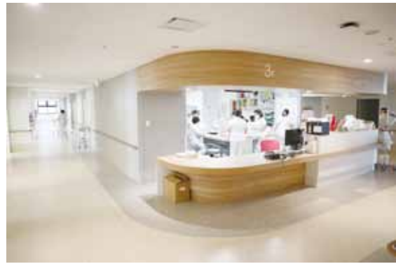
スタッフステーション（病棟）