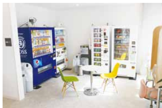
自動販売機コーナー